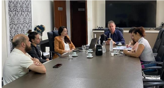
Visitas aos municípios de São Domingos e Vargeão