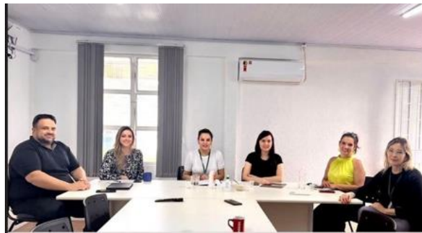
Visitas aos municípios de Xanxerê e Xaxim