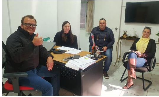
Visitas aos municípios de Passos Maia e Ponte Serrada