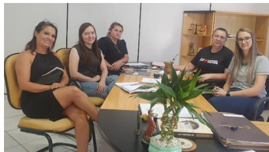
Visitas aos municípios de Ipuçu e Lajeado Grande