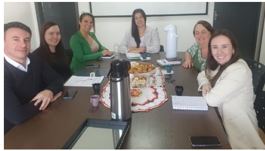
Visita aos municípios de Abelardo Luz e Bom Jesus