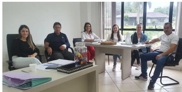
Visitas aos municípios de Marema e Ouro Verde