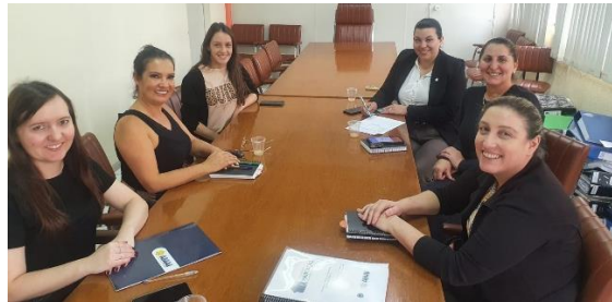
Visita aos municípios de Entre Rios e Faxinal dos Guedes