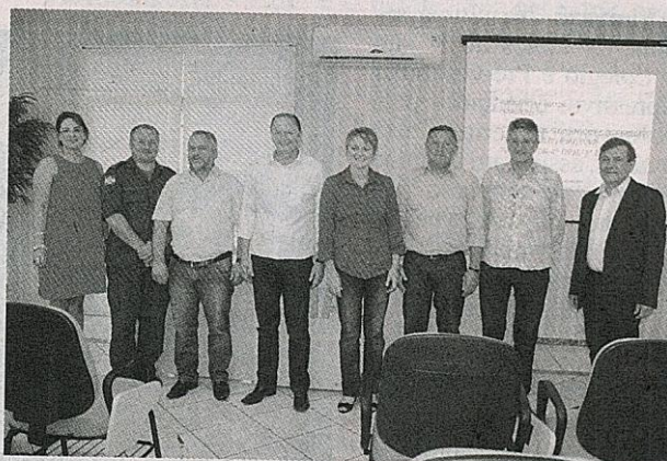
A audiência pública aconteceu na Associação dos Municípios do Alto Irani

Uma audiência pública já foi realizada em São Lourenço do Oeste e a deputada