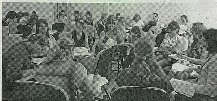
Curso realizado na sede da Amai

Entre os temas apresentados estiveram: aposentadorias, pensões, benefício de prestação continuada (BPC), salário maternidade e família, auxílio doença e acidente, formas de contribuição e legislação.