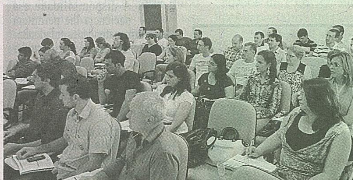
O evento prossegue nesta terça-feira

Participam do Curso Secretários de Administração, Contadores e Técnicos responsáveis pelo Patrimônio Municipal.