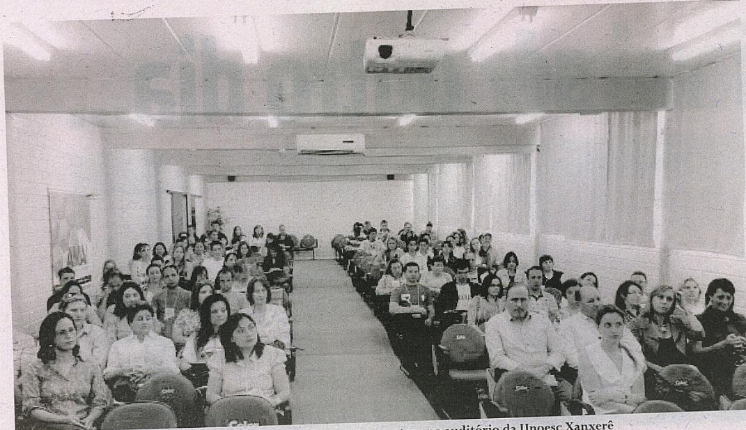
A primeira conferência aconteceu em Xaxim. Agora o evento acontece no auditório da Unoesc Xanxerê