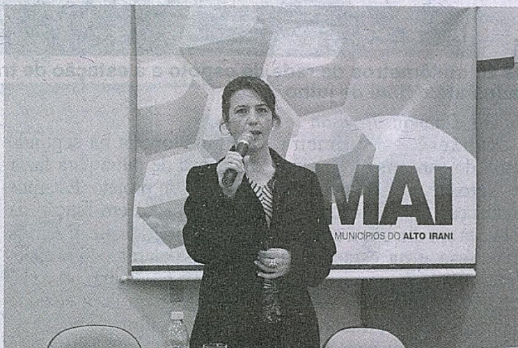
A diretora de cultura destacou que a discussão é uma “engrenagem” que precisa da participação de todos