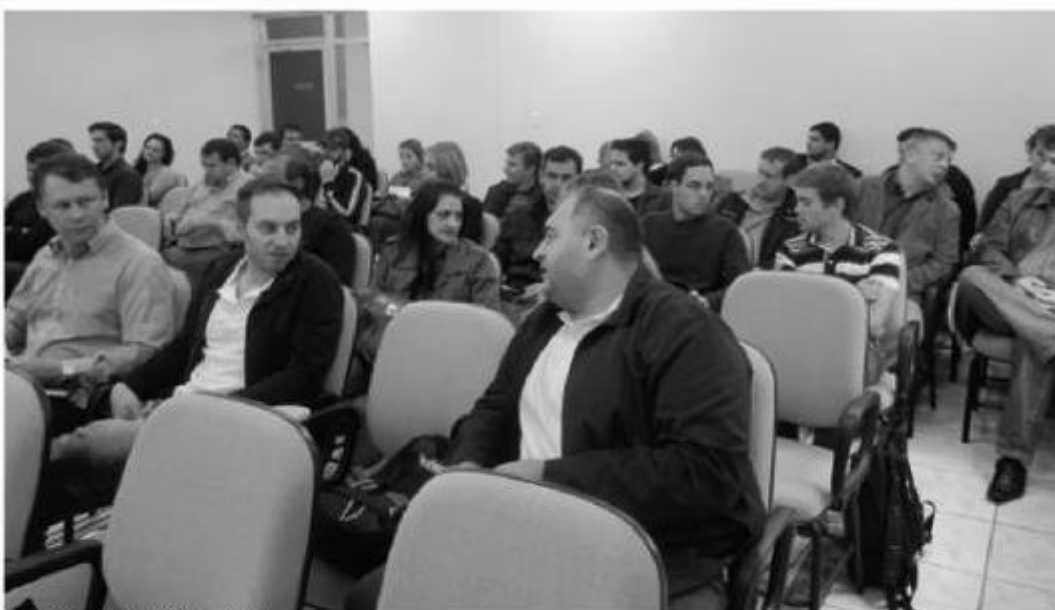
Auditério da AMAI ficou lotado

A Associação dos Municípios do Alto Irani (AMAI) e o Consórcio de Informática na Gestão Pública Municipal (CIGA) promoveram na última semana, dois encontros para esclarecimentos sobre o Diário Oficial dos Municípios (DOM) e o Programa de Gestão de Obras (PGO).