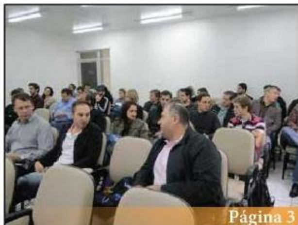
PGO e DOM são apresentados aos municípios da AMAI