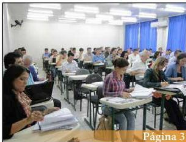
Curso do Siconv na AMAI recebeu técnicos de 45 municípios