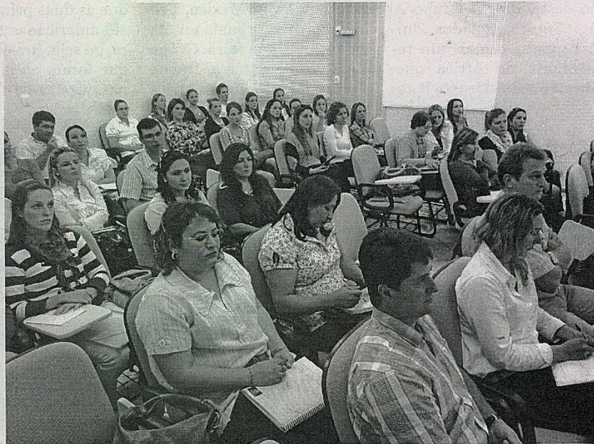
Encontros ocorrem durante esta semana