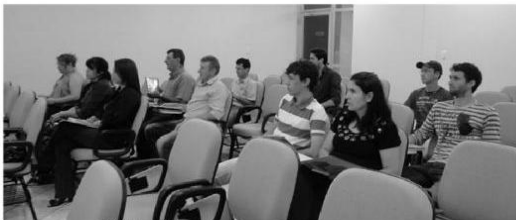
Encontro ocorreu no auditório da AMAI

A Associação dos Municípios do Alto Irani (AMAI) promoveu na última semana uma reunião de orientação sobre 5ª Conferência Municipal das Cidades. Neste ano, todos os municípios estão obrigados a realizar as conferências em âmbito municipal.