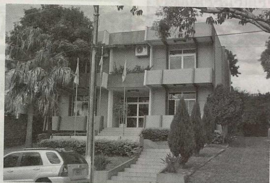
Entidade não terá uma programação especial este ano, somente em 2013