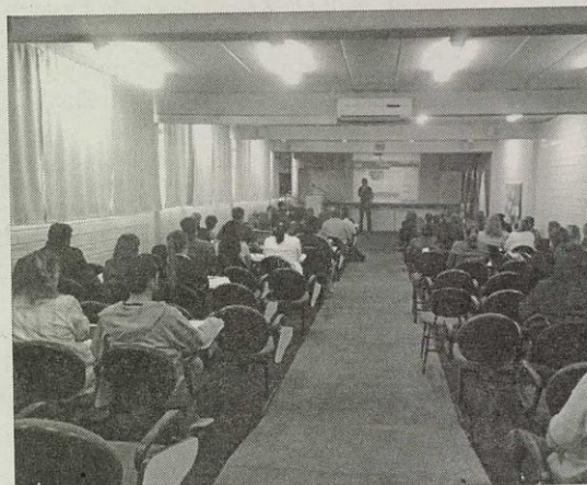
Curso aconteceu na última quinta-feira

Até o final de 2011, a prestação de contas sobre os recursos provenientes do FNDE era realizada em formulários impressos. Com a criação do Sigpc, todas as informações serão entregues de forma online.