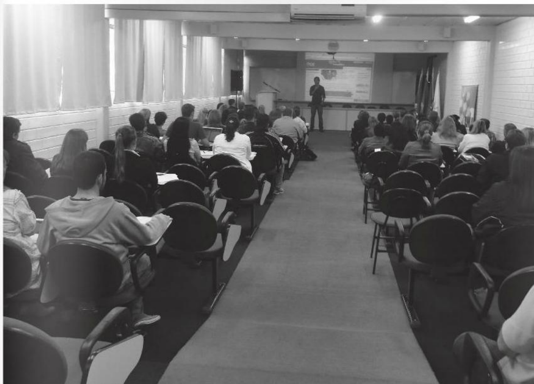
O evento lotou o auditório da Celer Faculdades, em Xaxim

A Associação dos Municípios do Alto Irani realizou na última quinta-feira (11) o curso sobre Prestação de Contas do Fundo Nacional de Desenvolvimento da Educação (FNDE). O evento lotou o auditório da Celer Faculdades, em Xaxim.