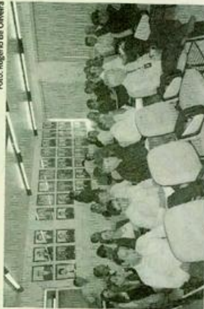
Escolha aconteceu na noite de ontem