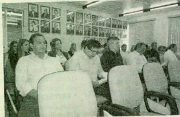
Assembleia aconteceu na última terça-feira