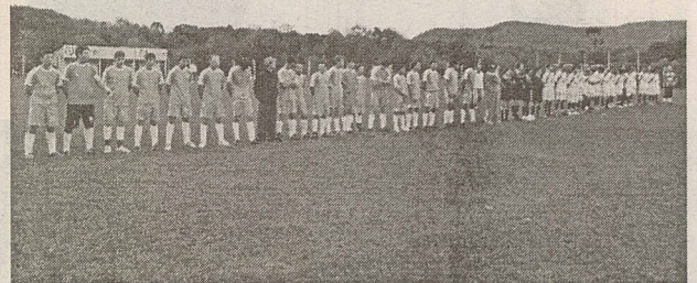
Equipes postadas durante a cerimônia de abertura