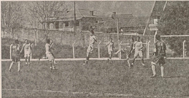
Tabajara é líder da chave A com seis pontos ganhos