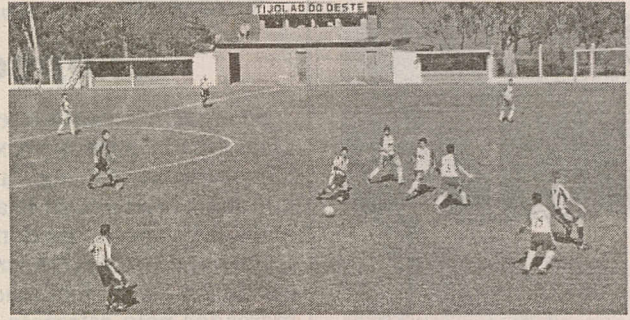
Olaria sofreu para vencer Galvão na tarde deste domingo