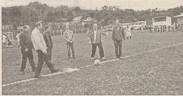
Ponta pé inicial da 30ª Copa Amai foi dado pelas autoridades presentes