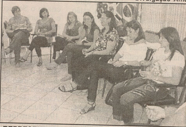
REPRESENTANTES dos municípios na reunião