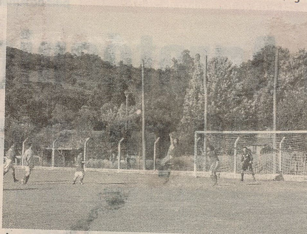
Jogos deste fim de semana

Em São Domingos, no estádio Alto da Colina, o