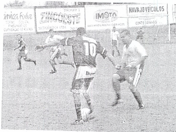
Copa Amai pode ter final xanxerense

Olaria, Inducolor/Três Estrelas, Bavial e Itagiba estão na próxima fase