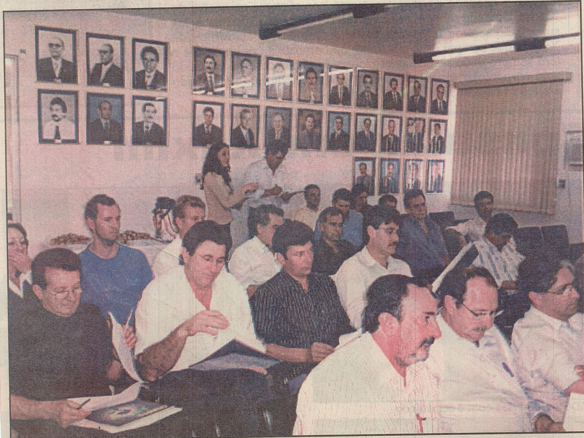
MAIORIA dos prefeitos da região participou da reunião na sede da Amai