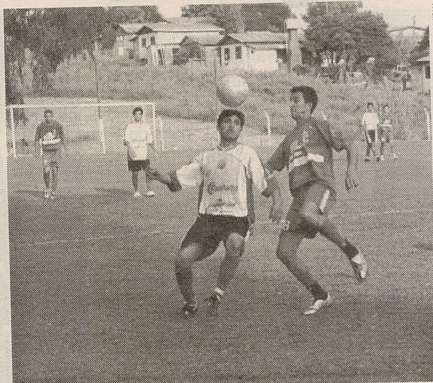
Inducolor/Três Estrelas vence de virada e lidera chave

A rodada se completou com a vitória da equipe do Três Quedas, de Abelardo Luz, sobre a CME de Ipuçu. No próximo domingo, dia 23, seis jogos movimentam a 6ª rodada: