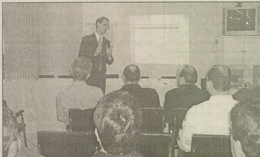
ASSESSOR da Fecam deu orientações aos prefeitos da Amai