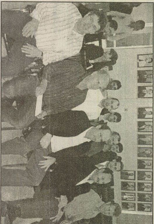
PREFEITOS da região discutem lei sobre saneamento básico

Em Assembléia Extraordinária, os prefeitos da Amai foram reunidos para debater, com o assessor jurídico da Federação Catarinense de Municípios (Fecam), Marcos Fey Probst, questões ligadas ao associativismo municipal na estruturação da gestão de saneamento básico, Lei 11.145/2007. "Esta Lei trouxe um novo marco regulatório de todo o saneamento básico em nosso país. A lei traz obrigações a todos os entes da federação em especial o município que compreende ser o titular do serviço, apesar do STF ainda não ter analisado uma ação que colocará um ponto final na ques-