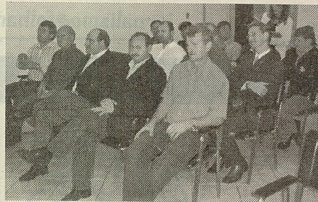
Prefeitos da Amai em palestra com Marcos Frey Probst

Por saneamento básico hoje se deve entender: fornecimento de água, tratamento de lixo e esgoto e drenagem de águas pluviais. Para o palestrante, "a Casan é um órgão muito importante no estado, que certamente passará por mudanças para se adequar à nova lei. A Casan presta serviços de água e esgoto em grande parte de municípios. Mas hoje os municípios têm um déficit muito grande no tratamento de esgoto e essa será a próxima grande missão da Casan, que além de fornecer água potável como ela faz hoje, deve incentivar, juntamente com os governos do estado e federal, a busca de recursos para os municípios e a própria Casan fazer o tratamento de esgoto, que é a grande meta e a grande prioridade do estado". Hoje, segundo o Ministério Público de SC, apenas 12% do esgoto é tratado, dados alarmantes que colocam o estado em penúltimo lugar