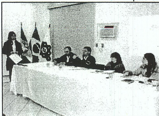
PREFEITOS se reúnem na sede da Amai

Outro assunto que o assessor jurídico da Fecam irá abordar na reunião é sobre o Con-