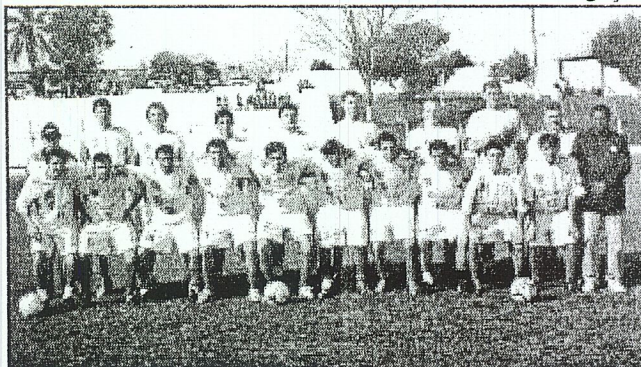
INDEPENDENTE estreia dia 26 de agosto na Copa Amai

Na semana passada aconteceu uma reunião com a comissão técnica, comissão de apoio e jogadores, objetivando tratar de assuntos relacionados à competição, bem como fazer um pacto para que a equipe seja unida e