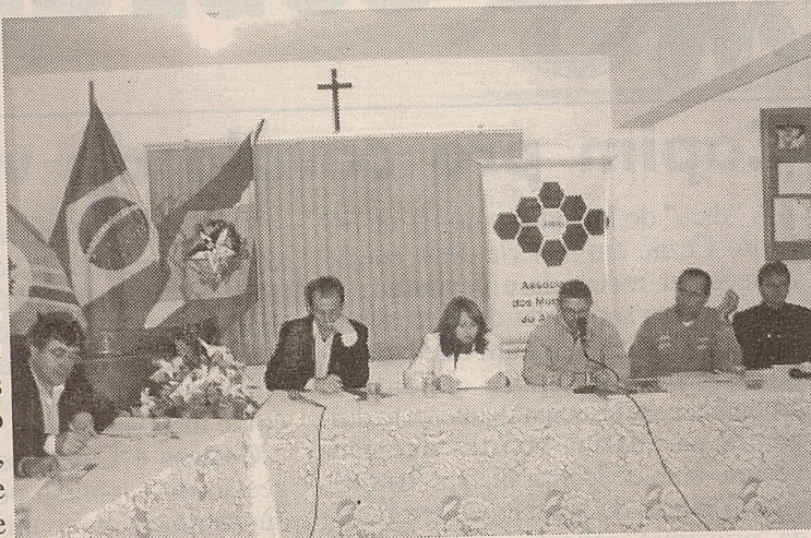
Prefeitos se reuniram em Bom Jesus

Bom Jesus – Na reunião mensal dos prefeitos do Alto Irani, realizada na última sexta-feira, 20 de julho – que integrou as festividades de aniversário do município –, a unanimidade dos prefeitos e vices presentes foi contrária ao