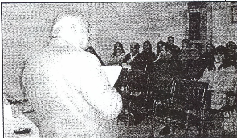
SECRETÁRIO visita municípios orientando sobre SC Recursos

O secretário-executivo afirma, ainda, que o mais importan-