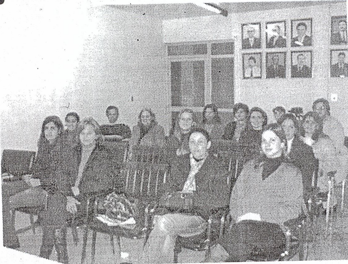
Através do colegiado, as ações serão feitas com maior agilidade