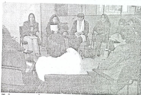
Três grupos foram formados

Desenvolvimento Regional, a Associação dos Municípios do Alto Irani e o Núcleo Regional de Assistentes Sociais. Participaram associações, clubes de mulheres, representantes de mulheres agricultoras, profissionais liberais, sindicalistas, vereadores, representantes do Judiciário e pessoas que trabalham com as políticas para as mulheres.