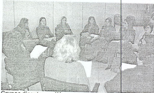
Grupos discutem políticas para as mulheres

A conferência desenvolveu três debates, abordando os seguintes temas: "Análise da realidade brasileira social e econômica, política e cultural e os