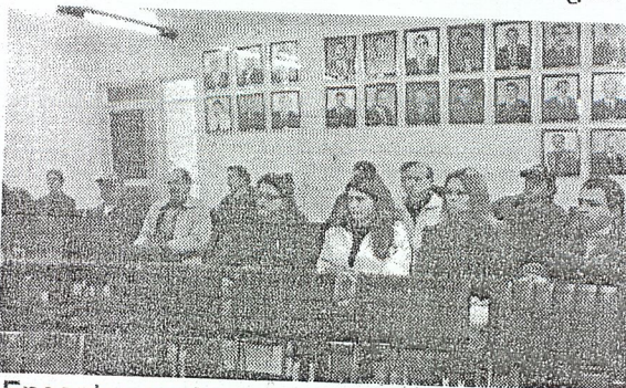
Encontro contou com a participação de representantes dos 14 municípios

Sua criação originou-se da elaboração, em 1997, do Plano de Desenvolvimento Sustentável da Área da Bacia do Rio Uruguai, apresentado ao Ministério do Planejamento e Orçamento e, posteriormente, à extinta Secretaria Especial de Políticas Regionais, abrangendo os estados do Rio Grande do Sul e Paraná e tendo como elemento estruturador a bacia