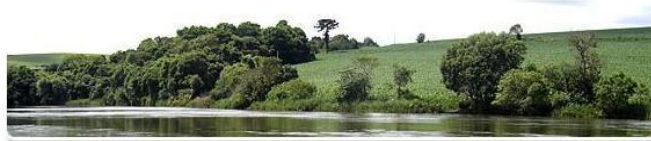
Rio Chapecó - Ouro Verde