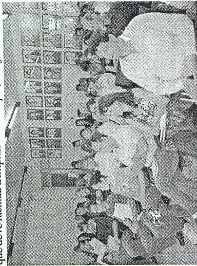
Até ontem, 18 municípios catarinenses já operavam o Regin, que deverá ser implantado em todo o estado em 2009