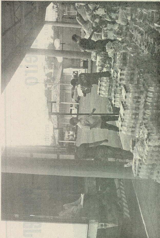
Márcio Roberto/Evandro de Lara

A campanha iniciada ao meio-dia da última quarta-feira, dia 26, pela Defesa Civil, Prefeitura e Secretaria de Desenvolvimento Regional já arrecadou 28.916kg de alimentos, 37.514 litros de água mineral, 17.840 unidades de produtos para higiene pessoal, 14.014 unidades de fraldas, 38.773 peças de roupas, além de 840 unidades diversas, como brinquedos. Apesar de ainda ter muito material estocado no parque, já foram encaminhadas seis cargas às cidades atingidas. Quatro cami-