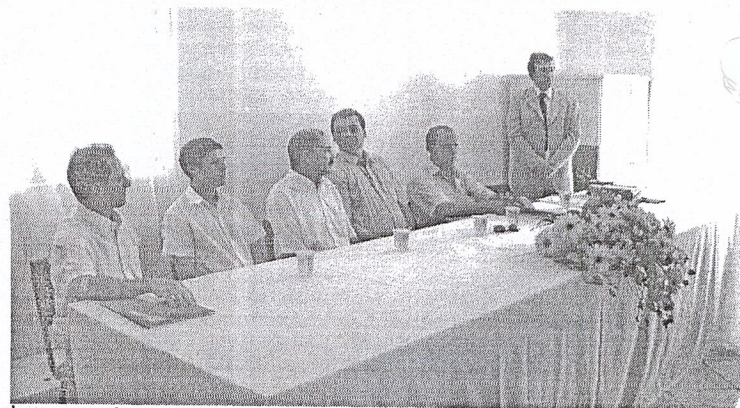
Lançamento aconteceu ontem em Xanxerê