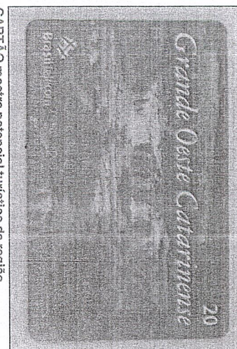
CARTÃO mostra potencial turístico da região

Aconteceu ontem, no auditório da Amai, o lançamento dos cartões telefônicos com paisagens da região. A iniciativa é uma parceria entre a Brasil Telecom e Santur, órgão de turismo do Estado.