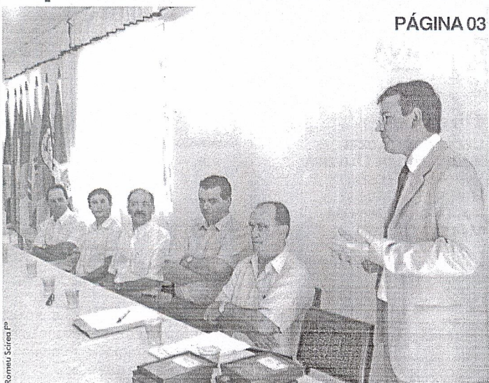
Os cartões foram lançados na tarde de ontem pela Secretaria de Desenvolvimento Regional de Xanxerê, Santur e Brasil Telecom