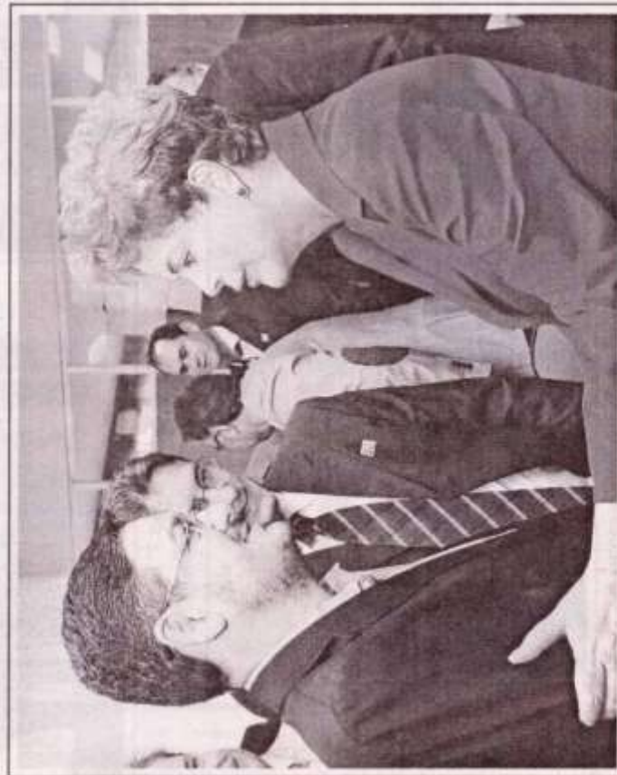
Prefeito Kiko agradece apoio e solidariedade da presidenta Dilma Rousseff com as famílias atingidas pelo tornado