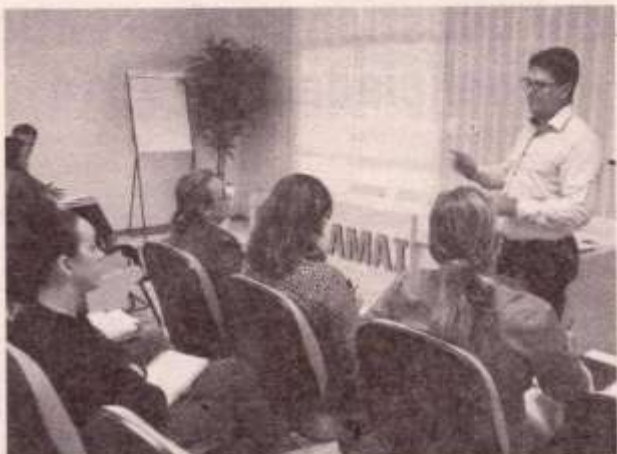
A última oficina de orientação foi realizada ontem

Foram promovidos na Amai cinco encontros de outubro de 2014 a maio de 2015. Durante este período todos os municípios