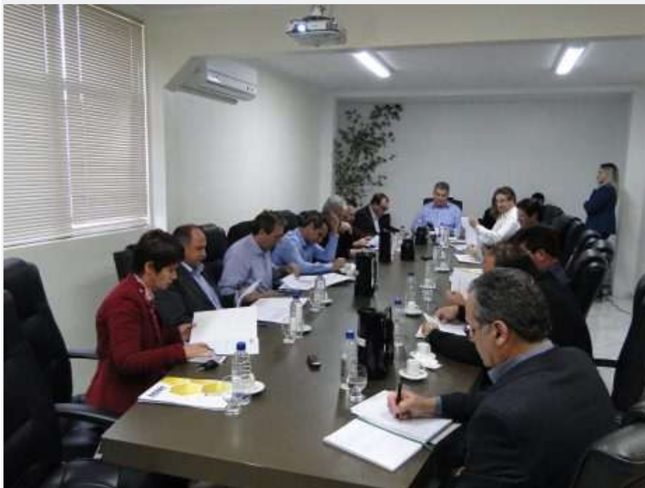
Prefeitos da AMAI

8 de agosto de 2017 - 07:33 / Comunidade Variedades Xanxerê | 0 Comentários