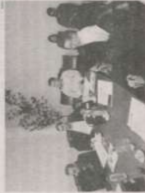
Prefeitos se reúnem no sede da Amait na segunda-feira (07)

Amait, foi apresentado um estudo preliminar sobre os serviços públicos oferecidos pelas administrações municipais. A ideia é estabelecer uma tabela de preços médios para a região. A Associação ficou responsável por apimentar a planilha e representar na próxima sessão.