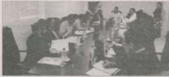
Prefeitos manifestaram apoio ao Projeto Saúde Superior

Os prefeitos aprovaram, ainda, o apoio à divulgação