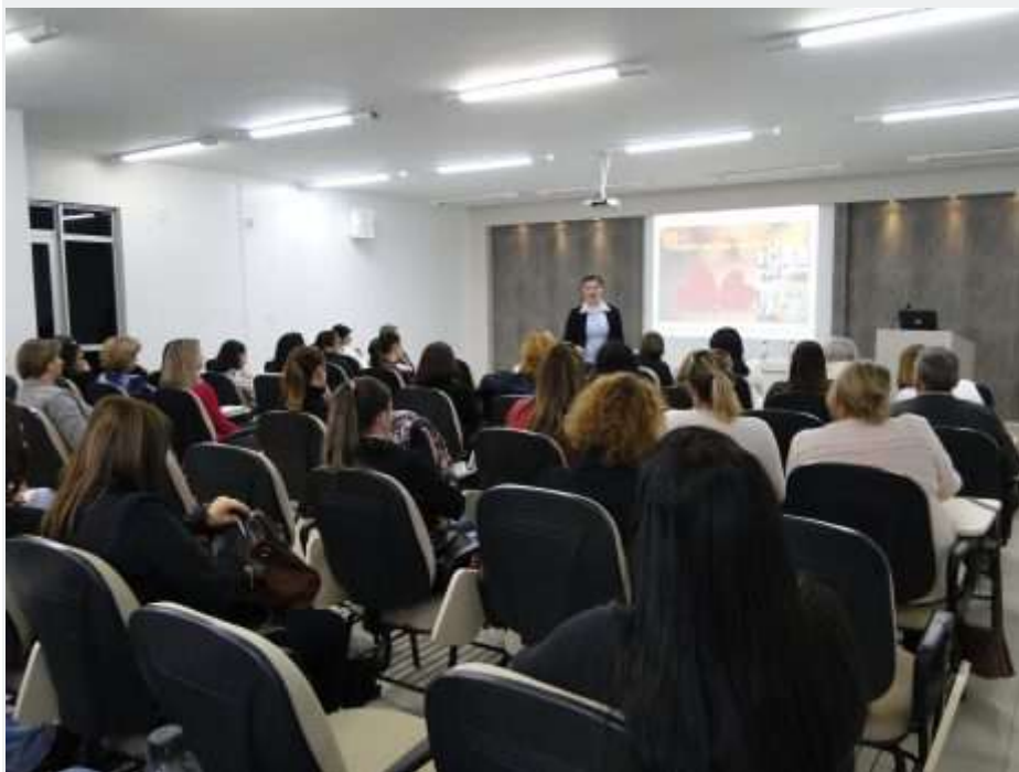
Lei dos Benefícios

16 de agosto de 2017 - 07:49 / Comunidade Variedades Xanxerê | 0 Comentários