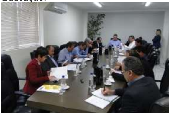
Prefeitos se reuniram em assembleia da Amai nesta segunda-feira